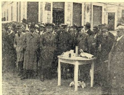
Comandanții formațiilor de pompieri rurali asistă la exercițiile de apărare pasivă.

A urmat apoi exercițiul de apărare pasivă.