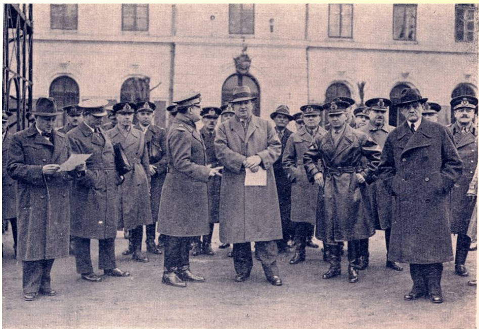
D-I I. Inculeț, Ministru de Interne însoțit de d-I Iuca, Subsecretar de Stat la Departamentul Internelor asistă la exercițiul de apărare pasivă făcută în curtea Postului Central de pompieri București (20 Apr. 1935).